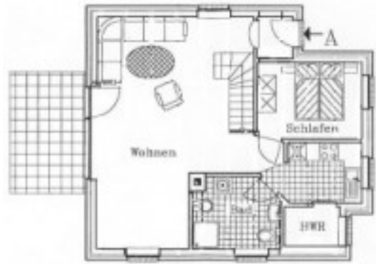
schematischer Grundriss Obergeschoss