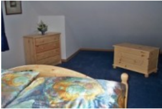
Schlafzimmer 3 im Obergeschoss