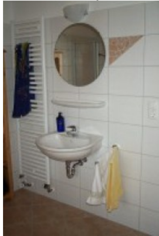
Duschbad im Erdgeschoss