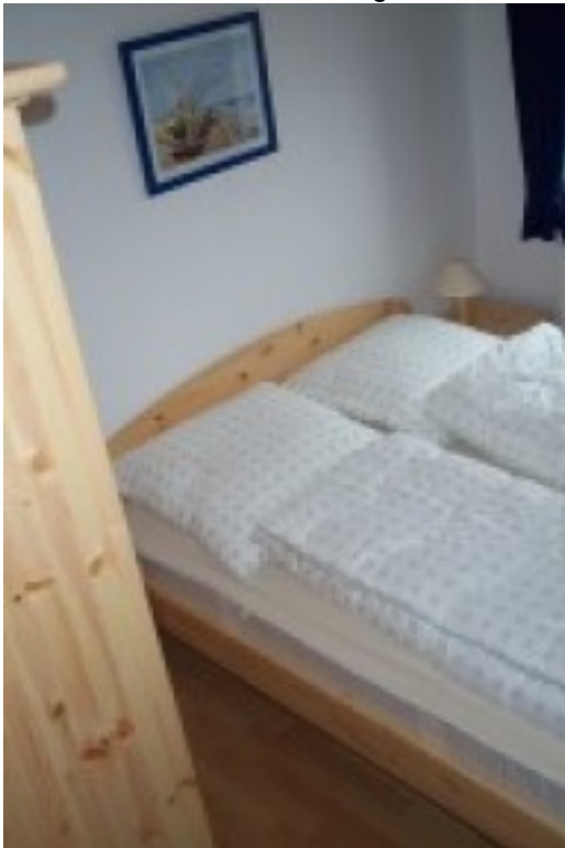
Schlafzimmer 1 im Erdgeschoss